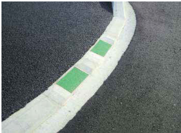
各務原市上中屋(ユニバーサルマウントアップ)