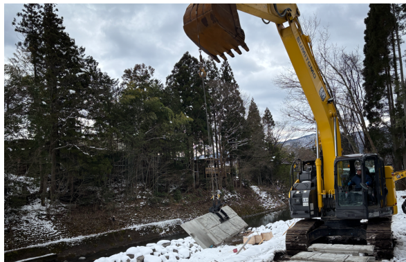
2. 専用治具でブロック本体を吊る