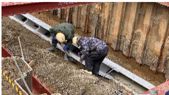
4. 裏込材を入れながら積む (1)