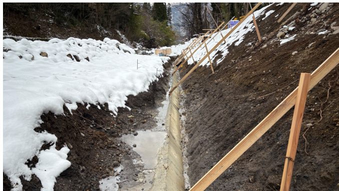
1. 基礎コンクリート打設