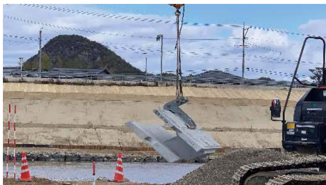
2. 専用治具でブロック本体を吊る