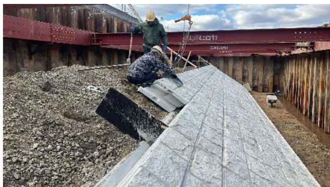
4. 裏込材を入れながら積む (2)