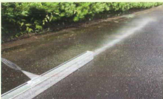
高圧洗浄機で簡単清浄